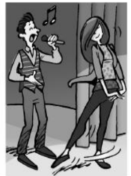
e) Il ★ et elle ★