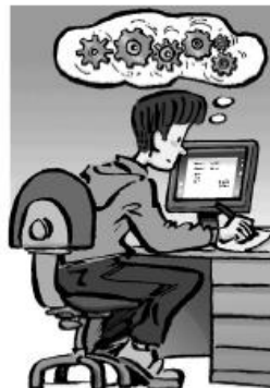
c) Il ★