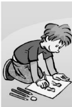
a) Il ★

1 Verbes d'action. Que fait chaque personne ?