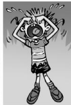
d) Elle ★