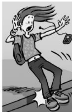
b) Elle ★